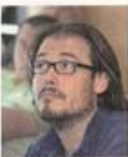
Olivier Michel Voyages N&M (69)