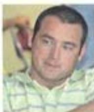
Arnaud Francotte Autocars Francotte (08)