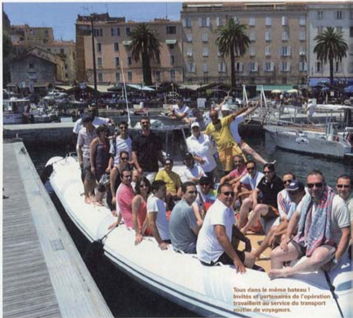
Tous dans le même bateau ! Invités et partenaires de l'opération travaillent au service du transport routier de voyageurs.

Dossier et photos réalisés par Pierre Cossard