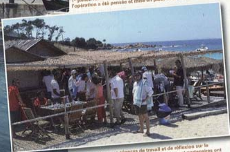
Après de longues séances de travail et de réflexion sur le management d'entreprise, jeunes dirigeants et partenaires ont pu largement profiter des joies balnéaires de l'île de Beauté.