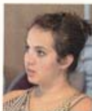
Ségolène Abbinante Launoy Tourisme (89)